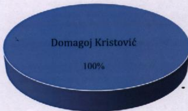
Vlasnička struktura prije i nakon mjera restrukturiranja

Tvrtka HIDRAULIČNI SISTEMI d.o.o. je u 100%-tnom privatnom vlasništvu, a vlasnik je Domagoj Kristović. Nakon restrukturiranja vlasnička struktura tvrtke neće se mijenjati. U nastavku se nalazi grafički prikaz vlasničke strukture prije i nakon mjera restrukturiranja.